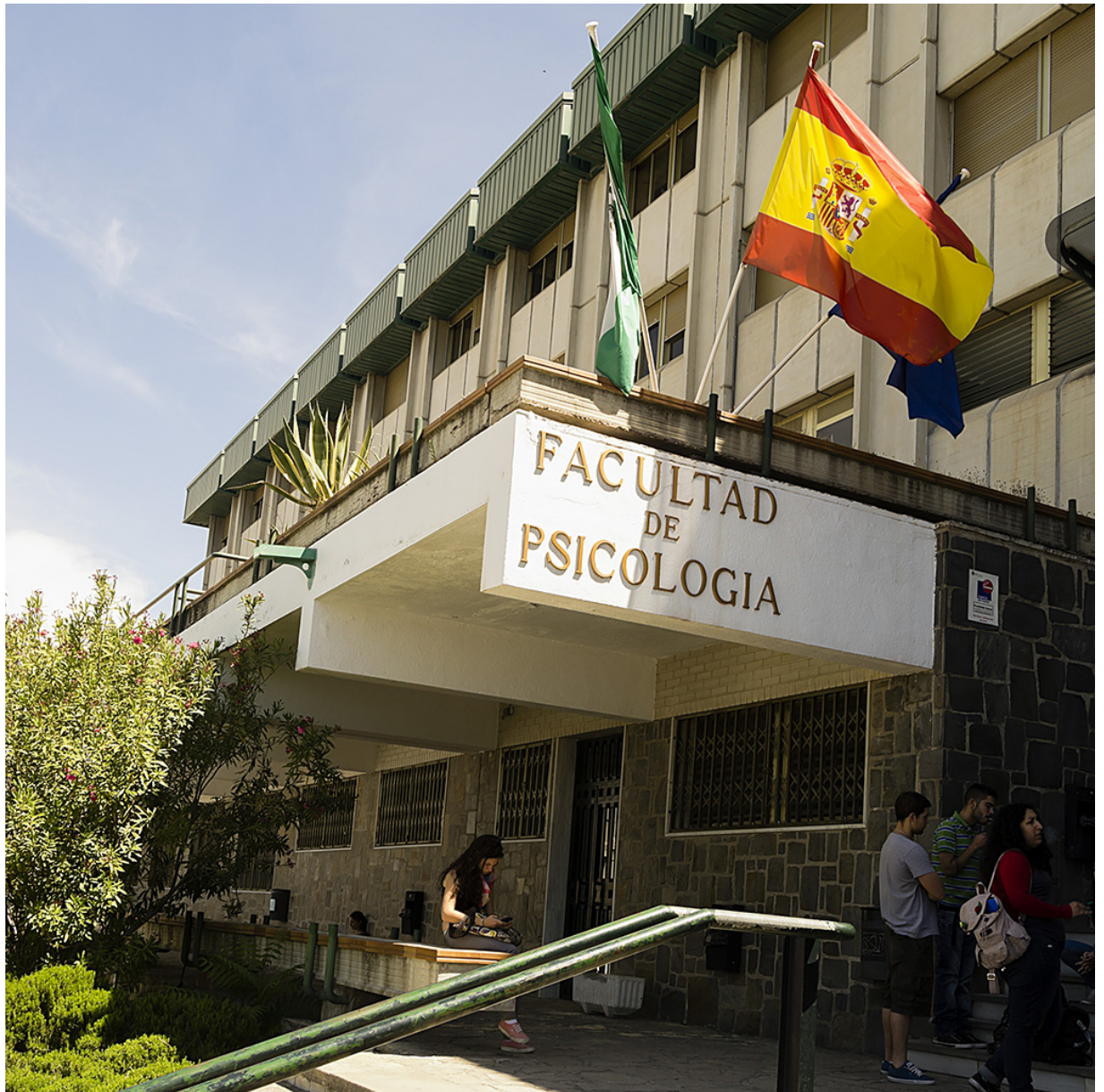
Web de la Facultad de Psicología