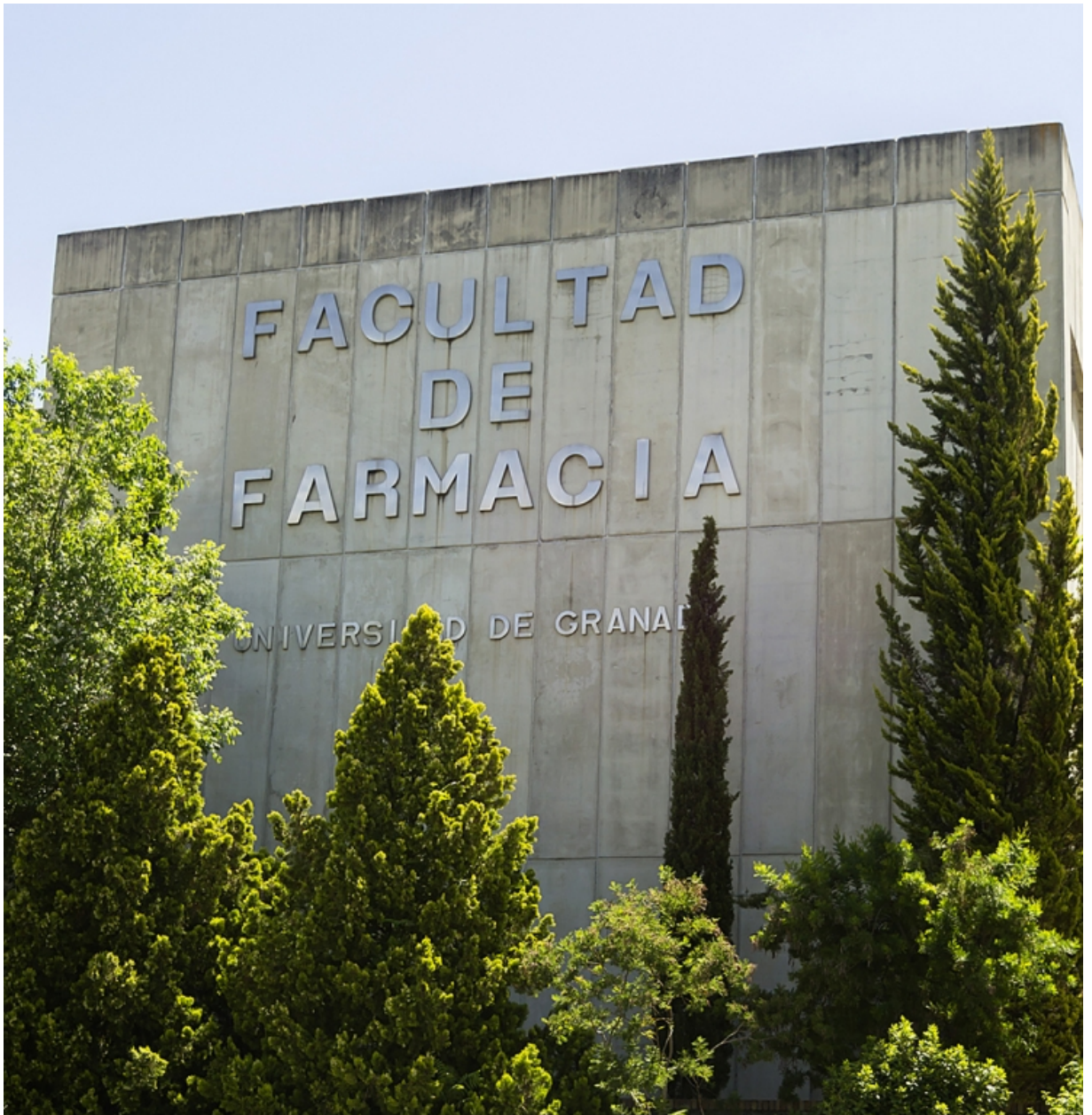
Web de la Facultad de Farmacia