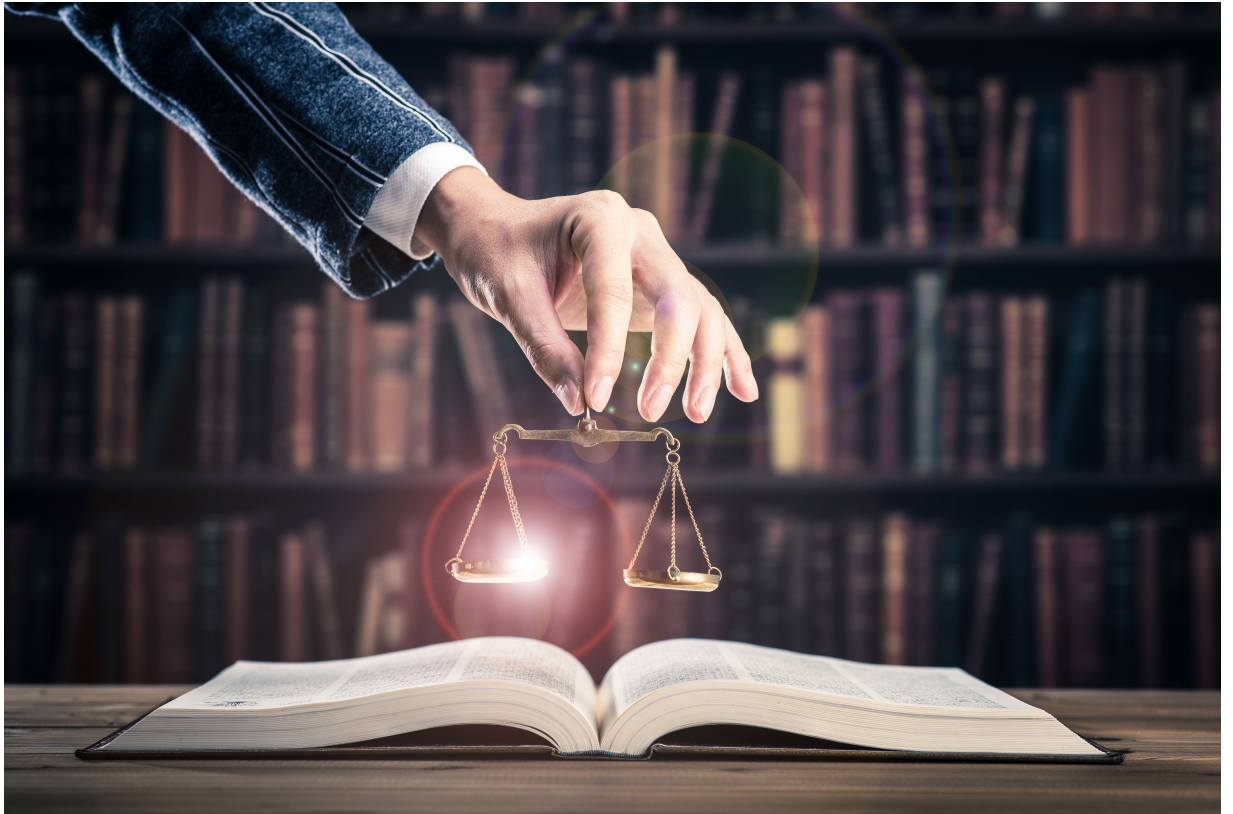
Normas de acceso y uso de la Biblioteca