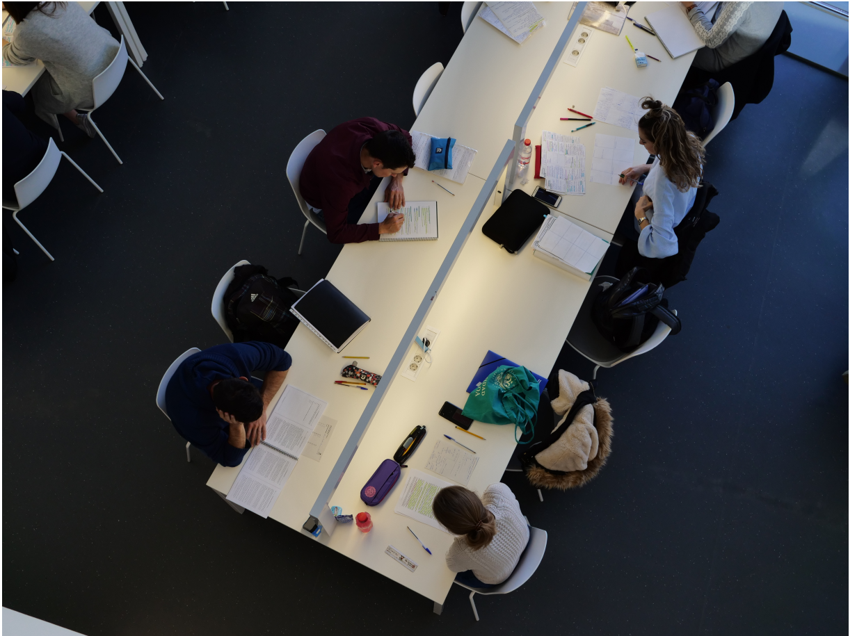
Cursos ofrecidos por la biblioteca