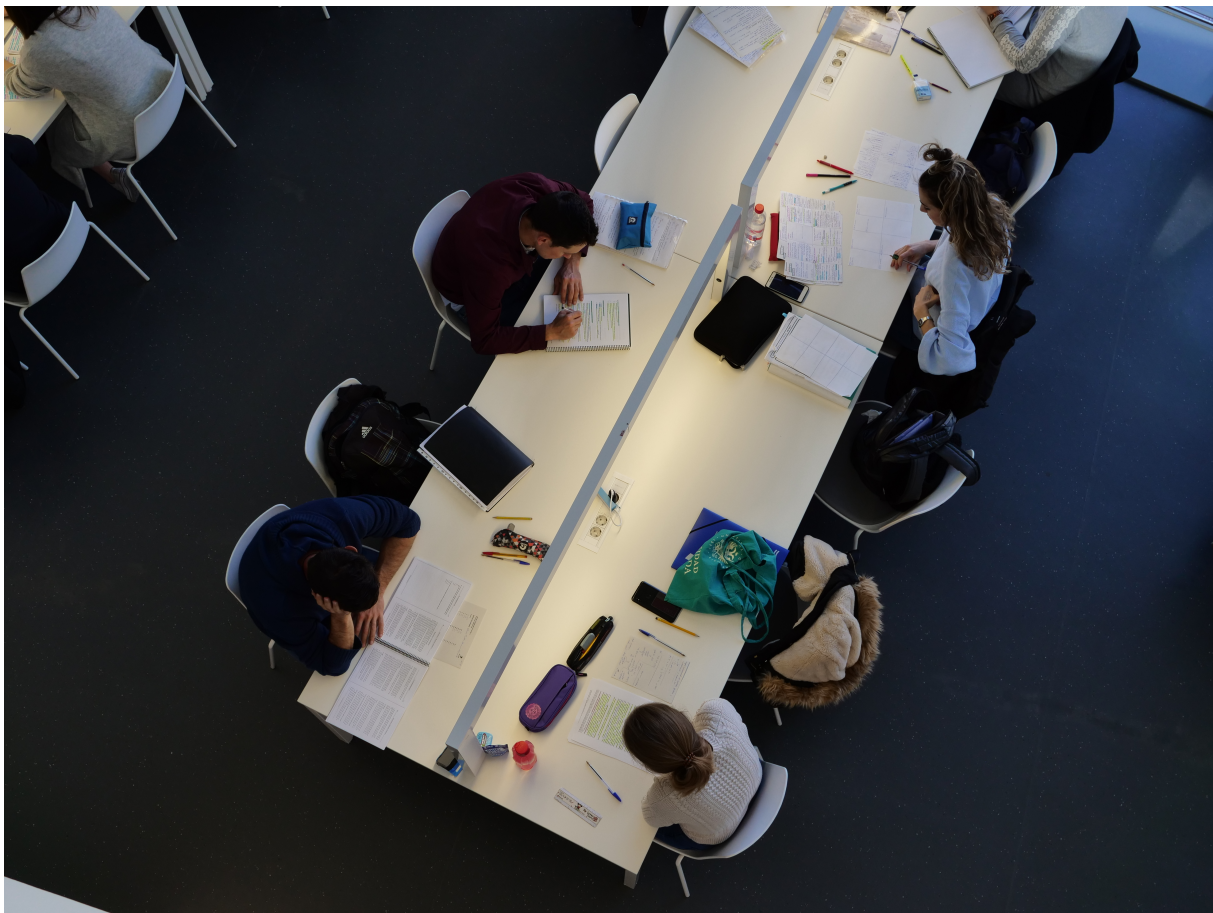
Cursos ofrecidos por la biblioteca