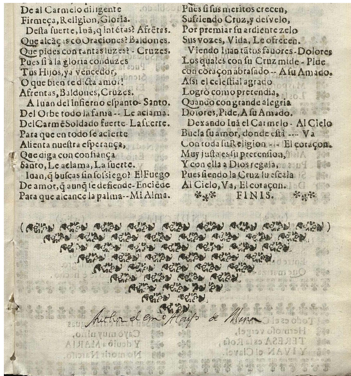
Poliedro Teresa de Jesús