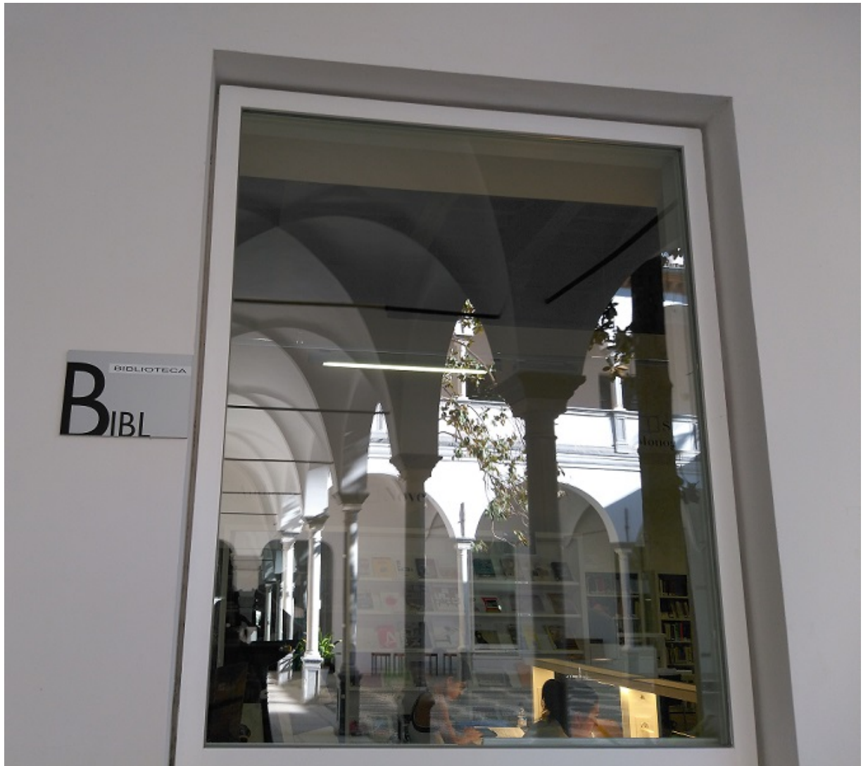
Web de la Biblioteca de la E.T.S. de Arquitectura